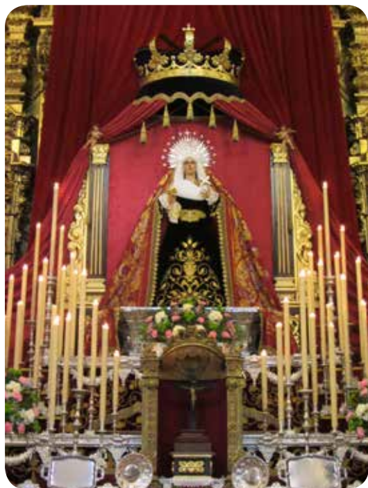
Altar de la Stma. Virgen de los Dolores. Cuaresma 2015