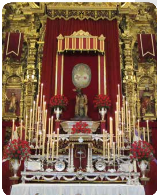
Altar Stma. Virgen de los Dolores. Septiembre 2015