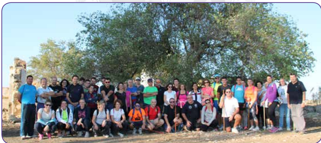
II Peregrinación a Consolación de Utrera 6 de junio 2015.