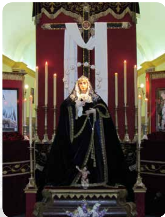
Altar 450 aniversario Hermandad de la Soledad