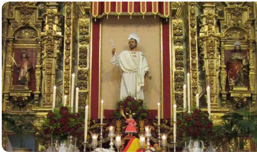
Altar triduo a Santiago Apóstol. Julio 2015