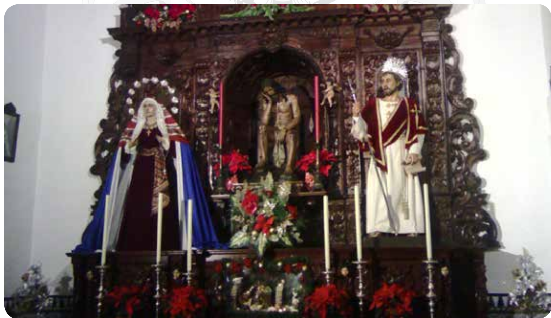
Altar de nuestros Sagrados Titulares en Navidad 2014