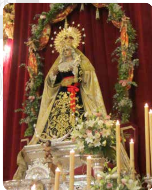
Altar del Stmo. Cristo de la Humildad. Cuaresma 2015